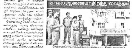
சென்னை ஜன. 11: சென்னை பெண் காவலர்களுக்கு புதுப்பிக்கப்பட்ட தங்கும் விடுதி. பெண் காவலர்கள் தங்கும் விடுதி.